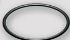
ΦΛΑΝΤΖΑ ΣΙΛΙΚΟΝΗΣ 200°C