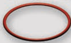
ΚΕΡΑΜΙΚΗ ΦΛΑΝΤΖΑ 160°C